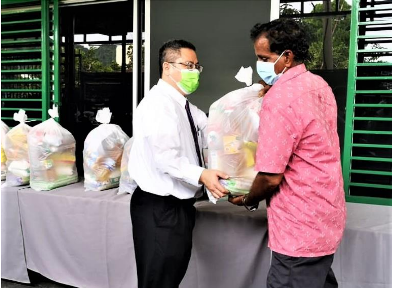
Seorang ahli Majlis Tinggi Daerah Kuala Lumpur Malaysia yang menjadi sukarelawan di pusat persatuan itu sedang mengedarkan pek barangan runcit kepada penerima.