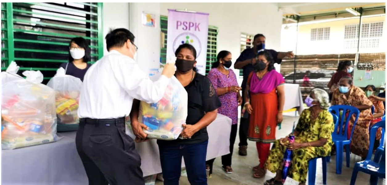
Seorang ahli dari Presidensi Daerah Kuala Lumpur Malaysia yang menjadi sukarelawan di pusat persatuan itu sedang mengedarkan pek barangan runcit kepada penerima.