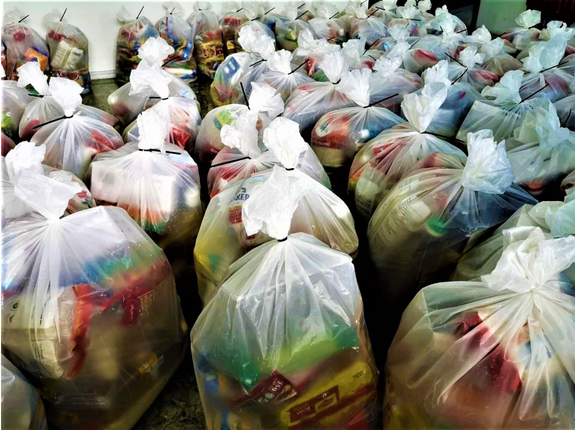
Bungkusan barangan runcit yang disumbangkan oleh LDS Charities memenuhi sebuah bilik di pusat persatuan.