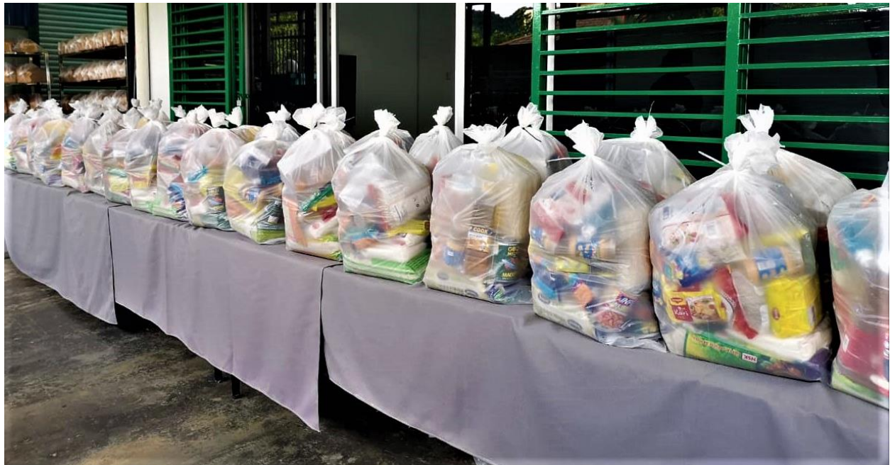
Barangan runcit sumbangan LDS Charities kepada Persatuan Perkhidmatan Sosial dan Pembangunan Komuniti (PSPK) Daerah Gombak, Selangor di Malaysia.

LDS Charities, Presidensi Daerah Kuala Lumpur Malaysia, dan Majlis Komunikasi Kebangsaan Gereja di Malaysia terus menyokong usaha pertubuhan itu untuk membangunkan kemahiran berdikari dan berdaya usaha di kalangan wanita yang dan keluarga mereka yang memerlukan di Selangor, Malaysia.