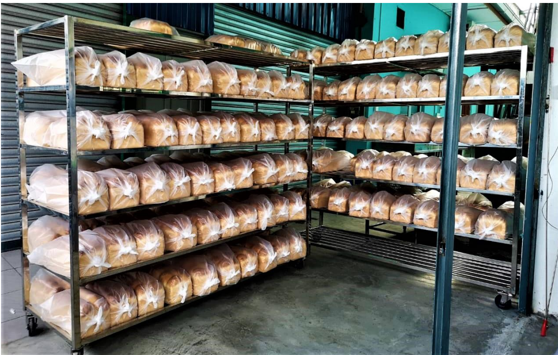
Dua ratus pek roti sedia untuk diedarkan. Setiap pek mempunyai empat ketul roti berjumlah 800 keping roti yang dibakar oleh PSPK untuk golongan miskin dan memerlukan yang terjejas akibat pandemik.