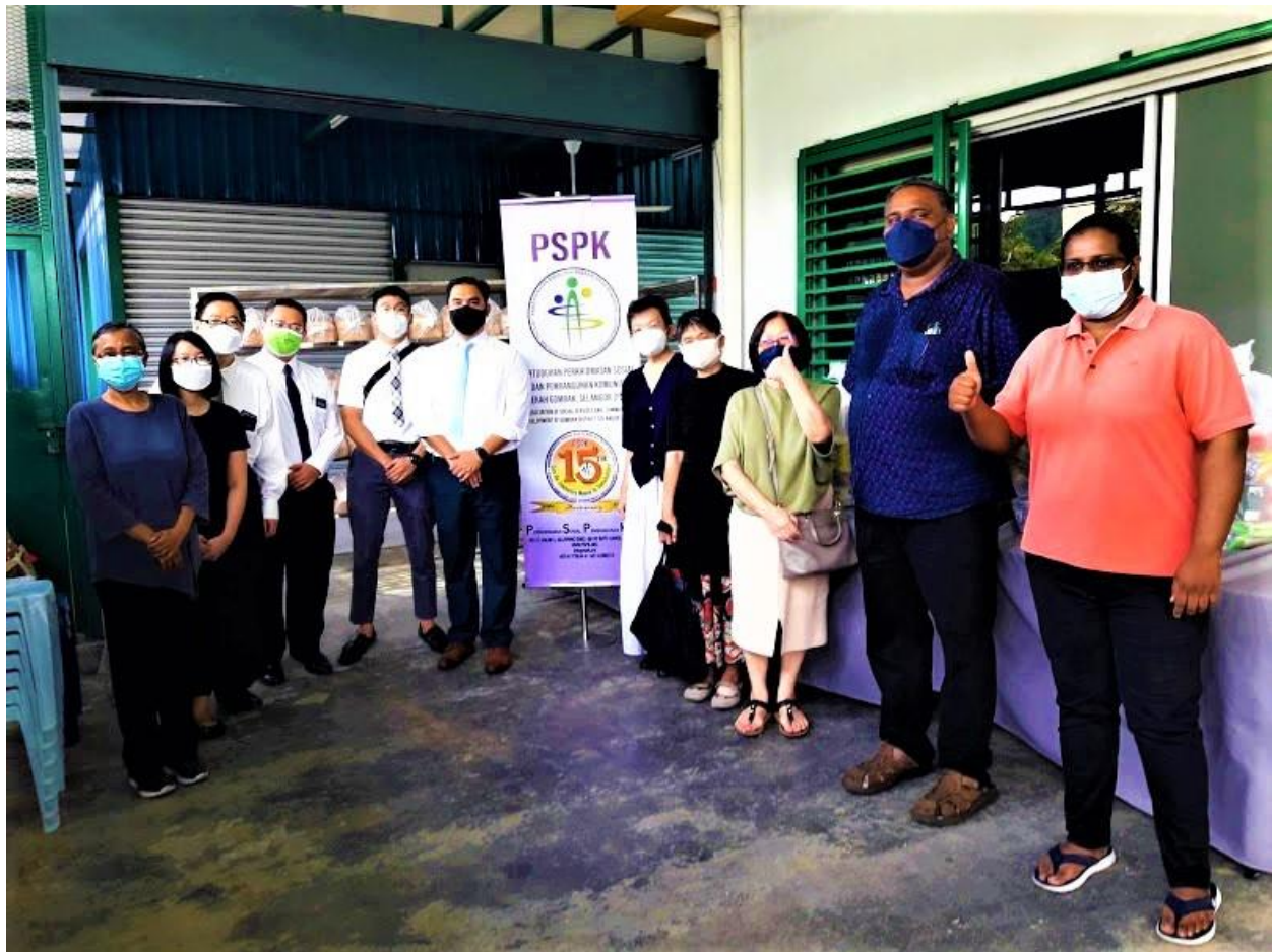
Ahli-ahli gereja dari Presidensi Daerah Kuala Lumpur Malaysia, ahli-ahli dari Majlis Komunikasi Kebangsaan Gereja di Malaysia, sukarelawan Gereja, dan pemimpin persatuan itu berkumpul untuk gambar kumpulan.