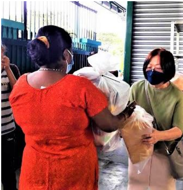
Seorang penerima dengan pek barangan runcitnya menerima roti bakar segar.