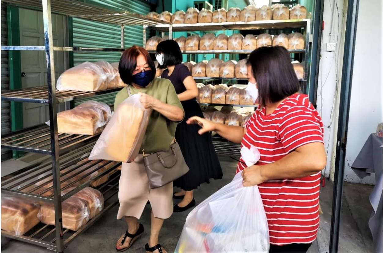
Seorang ahli Majlis Komunikasi Kebangsaan Gereja di Malaysia secara sukarela menyerahkan roti bakar segar kepada penerima di pusat pertubuhan itu.