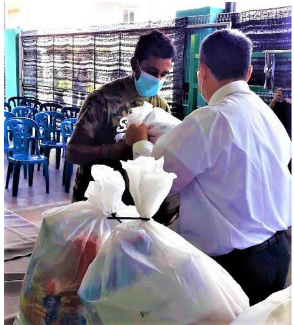
Seorang penerima menerima pek barangan runcit.